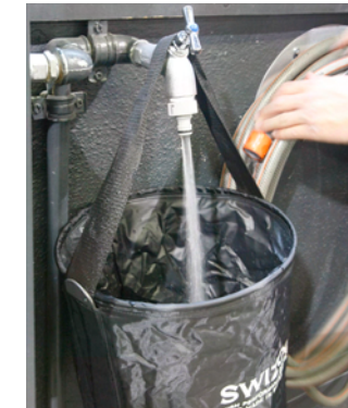
Erster Schritt: Mit klarem Wasser den Staub abwaschen und gründlich nachtrocknen

Nach der Wäsche wird abgetrocknet. Per Microfasertuch und nicht wie früher Auto-Waschleder vom Hirsch. «Das reibt zu stark und zieht das Wachs vom Lack», erklärt der Profi. Ausserdem sondert Leder durch Gerbstoffe immer etwas Fett ab. Das