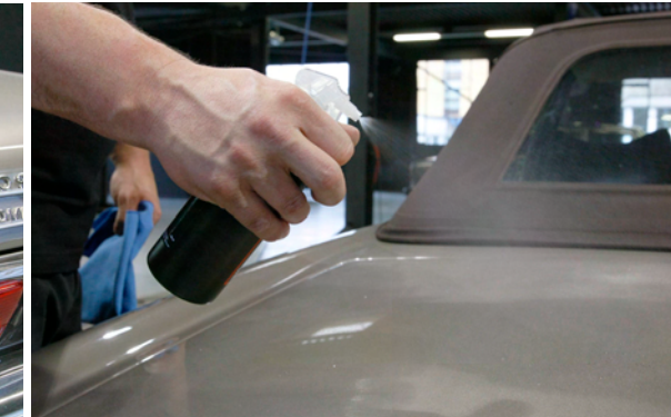
Zweiter Schritt: Mit Reiniger Oberfläche von Fett und Rückständen befreien.

So viel Staub und Schmutz fängt der Lappen ein, mit dem Reiniger oder Politur aufgetragen wird. Daher Microfasertuch regelmässig wenden (vierteln) und waschen.