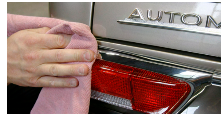
Dritter Schritt: Mit Politur (Schnellwachs) frischen Glanz auf Lack, Chrom und Kunststoff aufbringen.