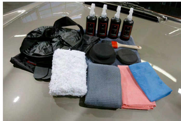
So sieht das Schnellpflegeset aus: Falteimer, Handschwamm, Pinsel, Waschpudel, Tücher und Sprays für Pneu, Reiniger, Politur und Pflege.

Die Schnellpflege fürs Auto ist leicht geschehen. Wasser, Tücher, Reiniger – mit den Tipps von Roberto Mercuri von Swizöl wird man zum Profi.