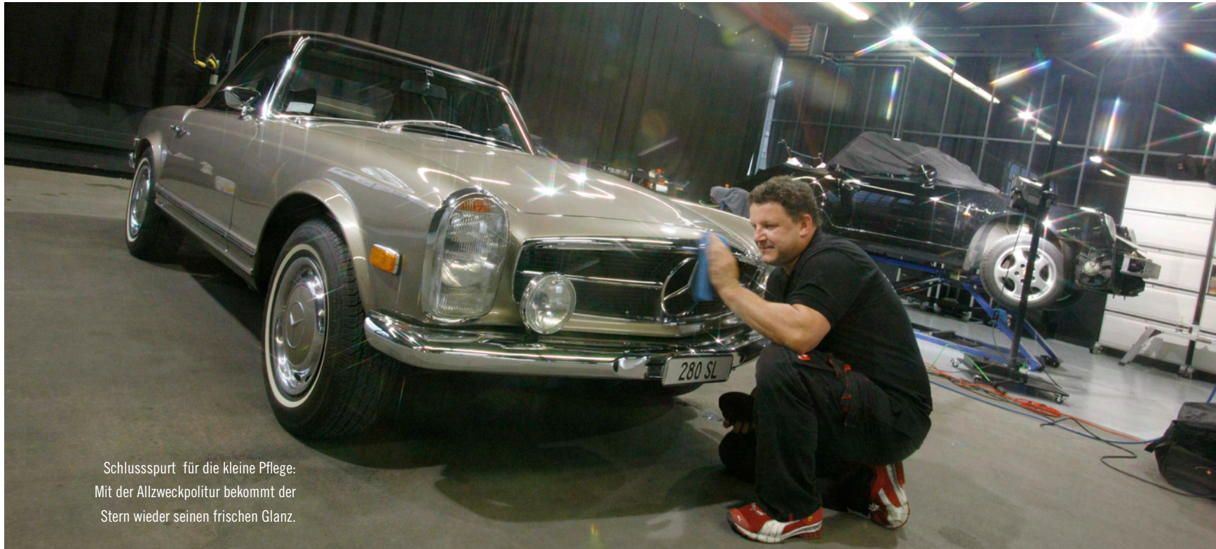
Schlusspunkt für die kleine Pflege: Mit der Allzweckpolitur bekommt der Stern wieder seinen frischen Glanz.