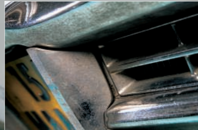
On le voit, des dépôts gras en surface (résultant de la pollution ambiante et des résidus de polish traditionnels) ont altéré le brillant de la peinture et des chromes. Mais le mal n'a rien de définitif.

TEXTE : ALAIN HALGAND