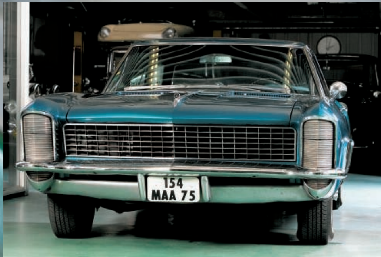
De loin, cette Buick Riviera 1965 semble tout à fait présentable. De près, les chromes ternis et la peinture un peu patinée sous-entendent un long et minutieux travail de lustrage.